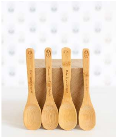
LOT 8 CUILLÈRES 8 SPOONS SET