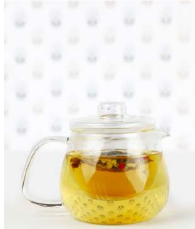
PETIT INFUSEUR TEAPOT

En chêne et fabriqué en France Oak-wood and made in France