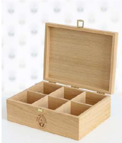
COFFRET DE PRÉSENTATION PRESENTATION BOX

En chêne et fabriqué en France Oak-wood and made in France